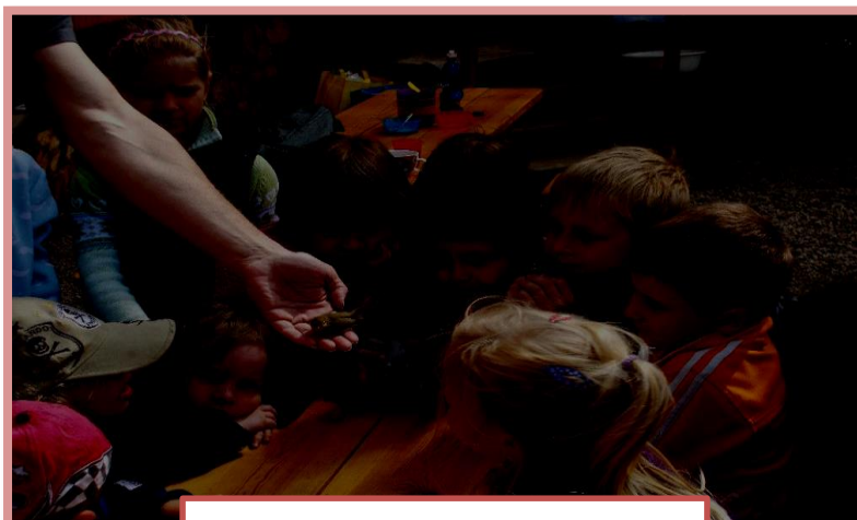
Děti při setkání s ornitologem

Lesní školka KOLEPA prošla další možnou cestou svého vývoje. Před námi se otevírají cesty i cestičky další, zatím neprobádané, i když částečně již naplánované. Už se těšíme, jak společně s dětmi poskládáme kaleidoskop jednotlivých činností a rituálů, které nás provedou dalším školním, ale i kalendářním rokem.