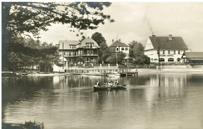
Máchovo jezero 1928.

Kraj kolem Doks, Oken, Holan či Kokořínska byl pro budování rybníků velmi vhodný. Nacházely se zde rozsáhlé lesy, mokřady, pískovcová údolí i dostatek drobných vodních toků. Mnohé rybníky, které dnes lidé znají jako rekreační místa, vznikly právě už ve středověku.