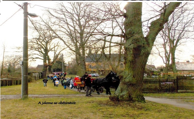
A jdeme se občerstvit